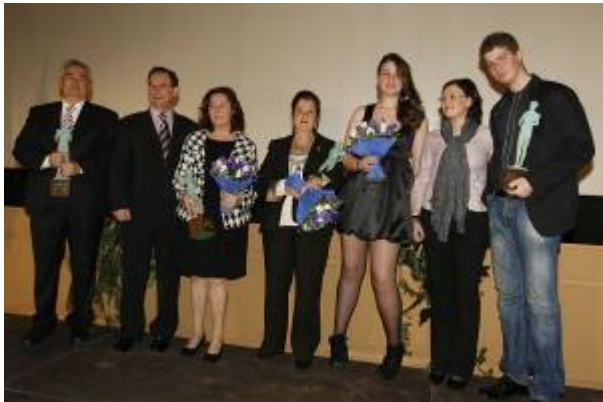
Destacadas en igualdad